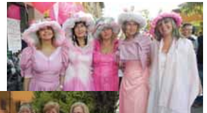
Le "fate" in rosa.