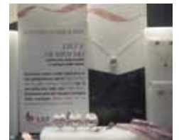
La vetrina del negozio Swarovski in via D'Azeglio.