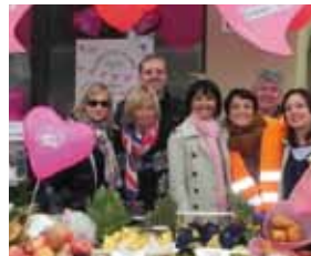
Ceretolo, un paese in rosa.