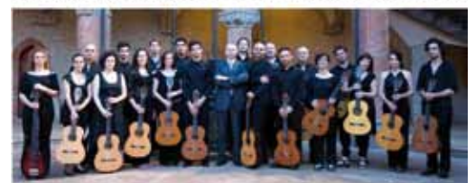
Spettacolo di beneficenza organizzato dal Lions S. Giovanni in Persiceto insieme al gruppo A.M.A di Terre d'Acqua.