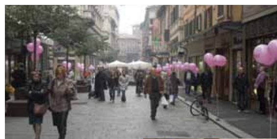
Via Orefici colorata dai nostri palloncini.

"Cinquedietisteinerba": da un po' di tempo queste giovani studentesse partecipano alle nostre iniziative, propongono ricette salutari e preparano deliziosi assaggi. Potete trovare le loro ricette al sito www.cinquedietisteinerba.blogspot.it